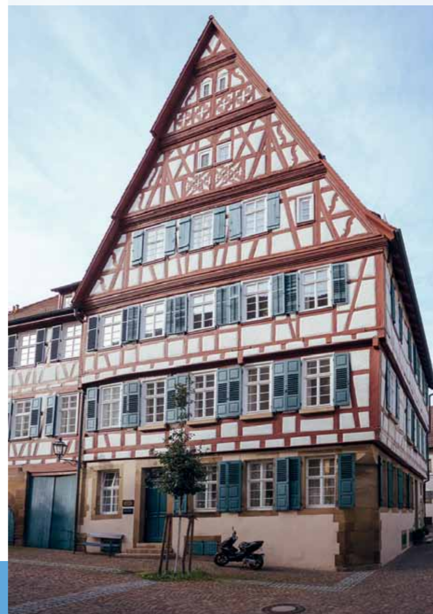
Die Kanzlei in der Kirchstraße 11 in Brackenheim