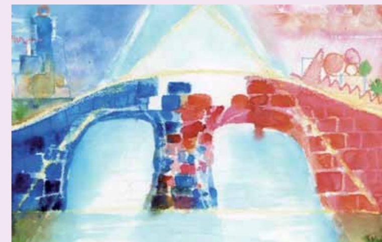
Brücke, die die Verbundenheit der beiden Gemeinen zum Ausdruck bringen soll

Am 30. Januar 2022 wird in einem gemeinsamen Festgottesdienst in der Martinskirche Meimsheim dieser „Brückenbau“ zur Verbundkirchengemeinde Meimsheim-Botenheim gemeinsam gefeiert. Der Festgottesdienst beginnt um 10 Uhr. Hierzu sehr herzliche Einladung.