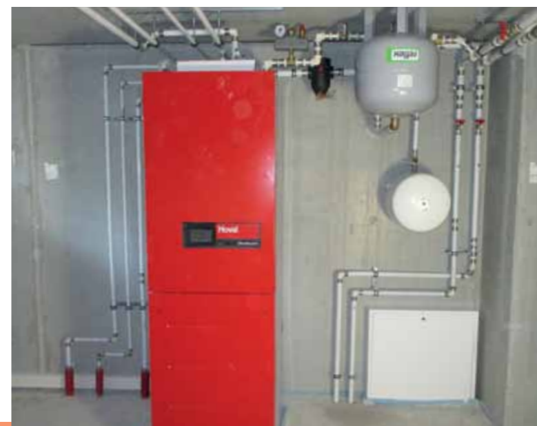
Blitzsaubere Installation einer Wärmepumpe durch prosermo