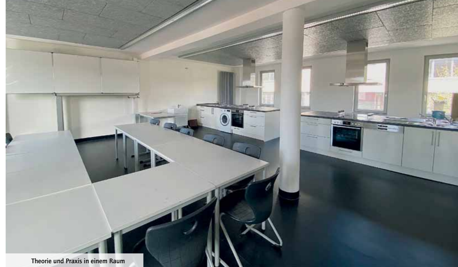
Theorie und Praxis in einem Raum