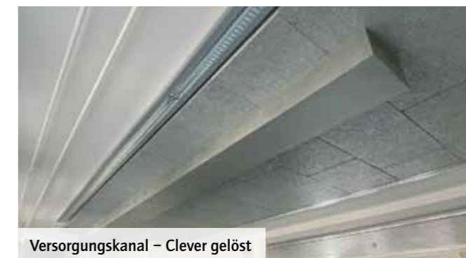
Versorgungskanal – Clever gelöst