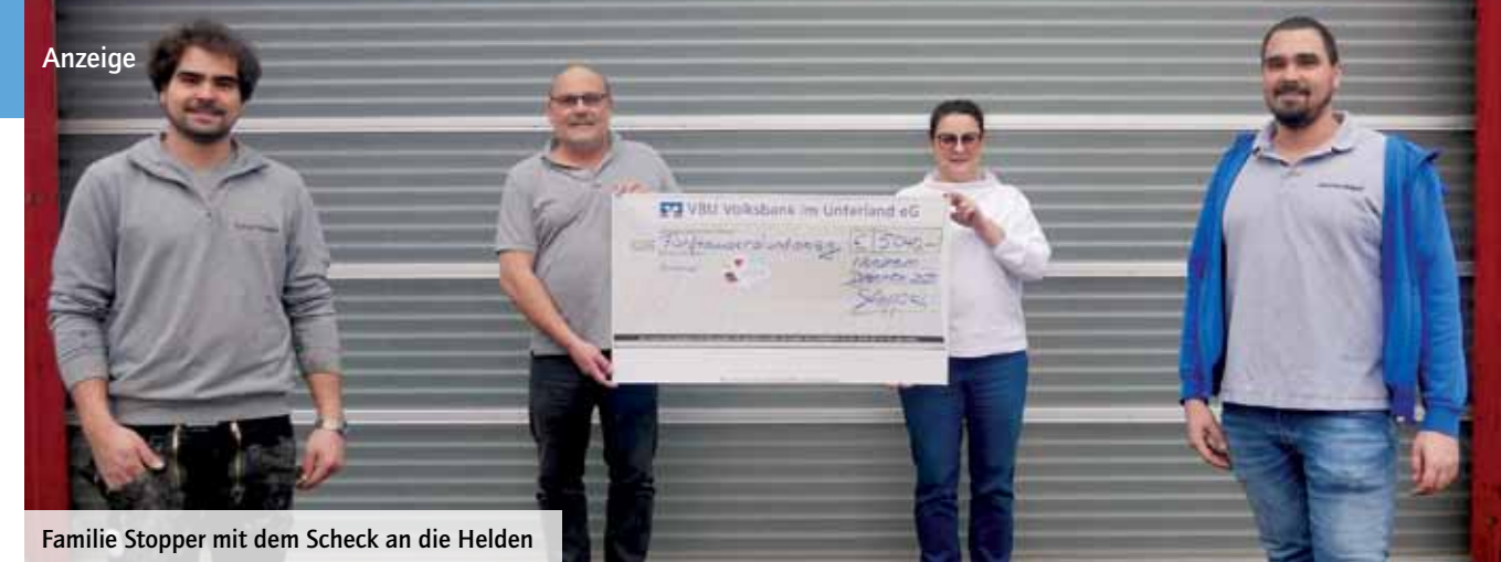
Familie Stopper mit dem Scheck an die Helden