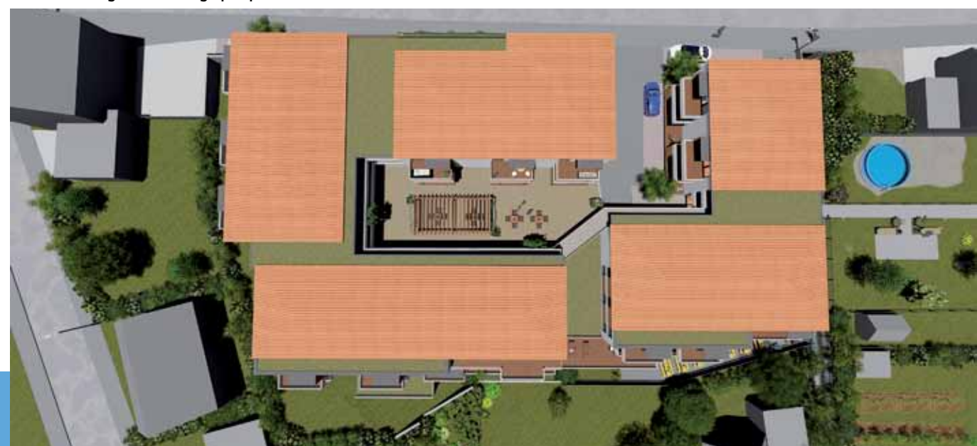
Die Wohnanlage aus der Vogelperspektive