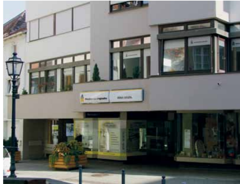
Generalvertretung der Mecklenburgischen Versicherungsgruppe in der Brackheimer Innenstadt