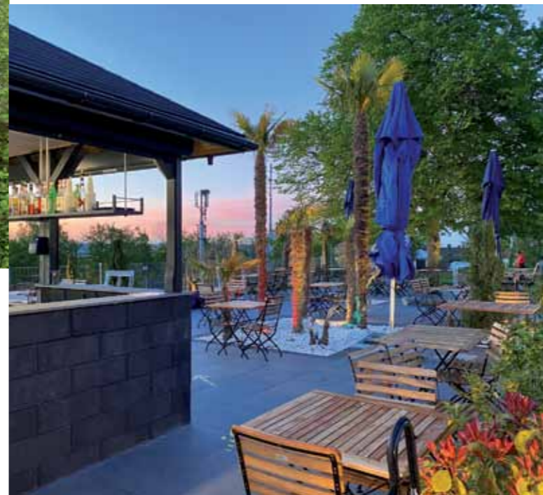
Sommerstimmung auf der Terrasse mit Cocktailbar und Palmen