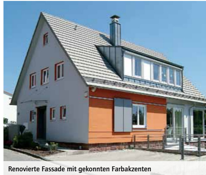
Renovierte Fassade mit gekonnten Farbakzenten