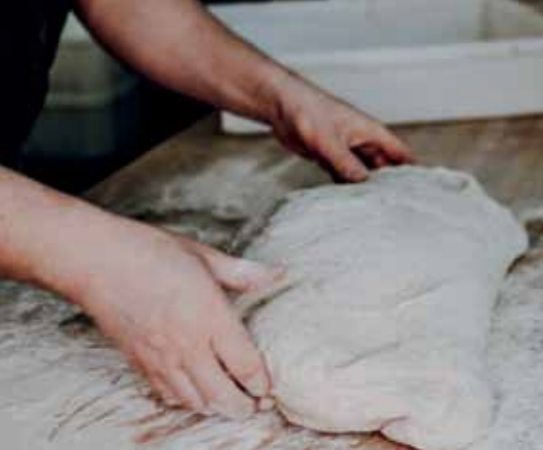
Frisch und mit Liebe von Hand gemacht...