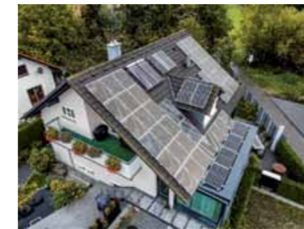
Nachhaltiges Trio: Wärmepumpe, Solar und Photovoltaik

kin Altherma 3 H HT beheizt. Mit Vorlauftemperaturen von bis zu 70 °C bei minus 15 °C Außentemperatur ist sie die optimale Lösung für Bestandsgebäude und den einfachen Austausch von Gas- und Ölgeräten. Markus Härle weiß genau, welche Vorteile die Wärmepumpe mit sich bringt: „Was uns vor allem an dieser Wärmepumpe überzeugt, ist die Tatsache, dass wir nur das Heizsystem austauschen mussten. So heizen wir auch weiterhin über die bereits vorhandenen Heizkörper und die Fußbodenheizung.“