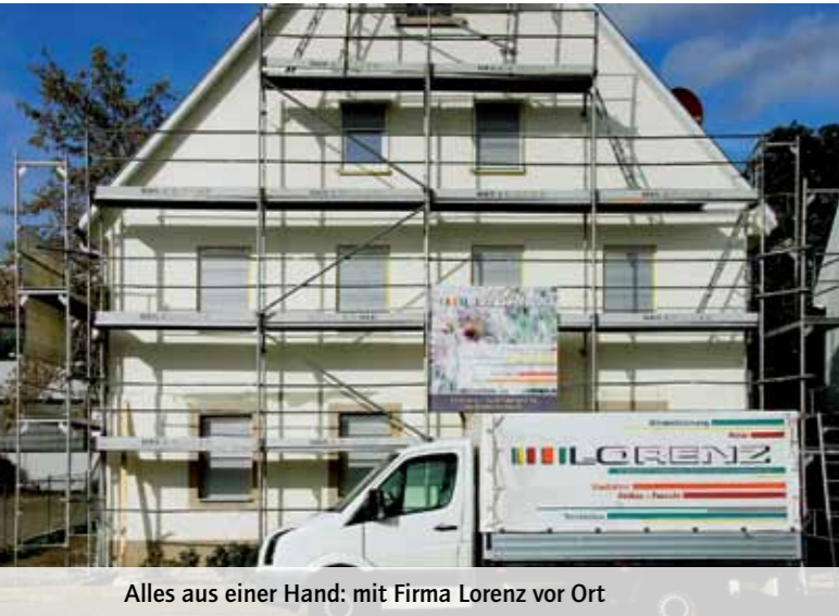
Alles aus einer Hand: mit Firma Lorenz vor Ort