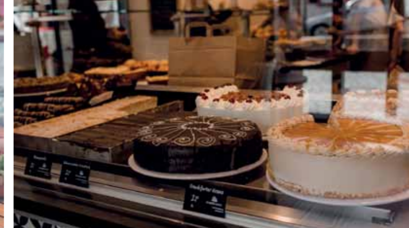
Kuchen und Torten aus der Konditorei