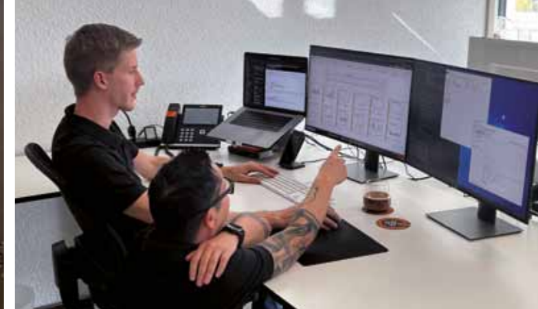
Manche Probleme lassen sich im Team besser lösen. Der Team-Gedanke wird bei Systemreich daher großgeschrieben.