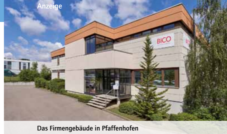
Das Firmengebäude in Pfaffenhofen