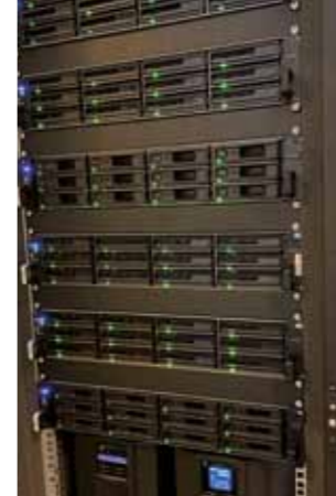
Speicher und Serversysteme für Klein- und Mittelständler