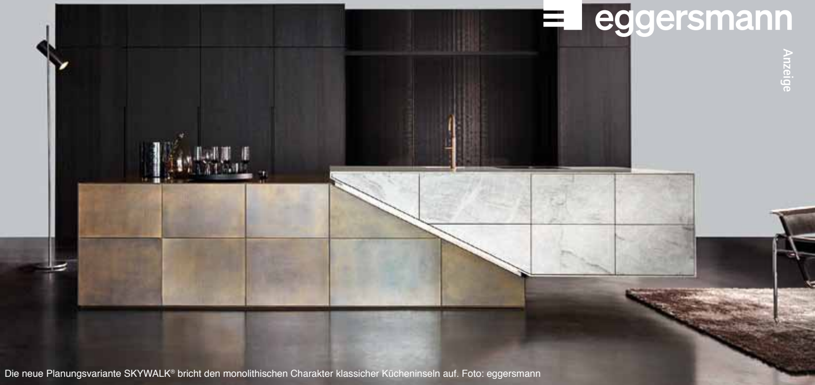
Die neue Planungsvariante SKYWALK® bricht den monolithischen Charakter klassischer Kücheninseln auf.