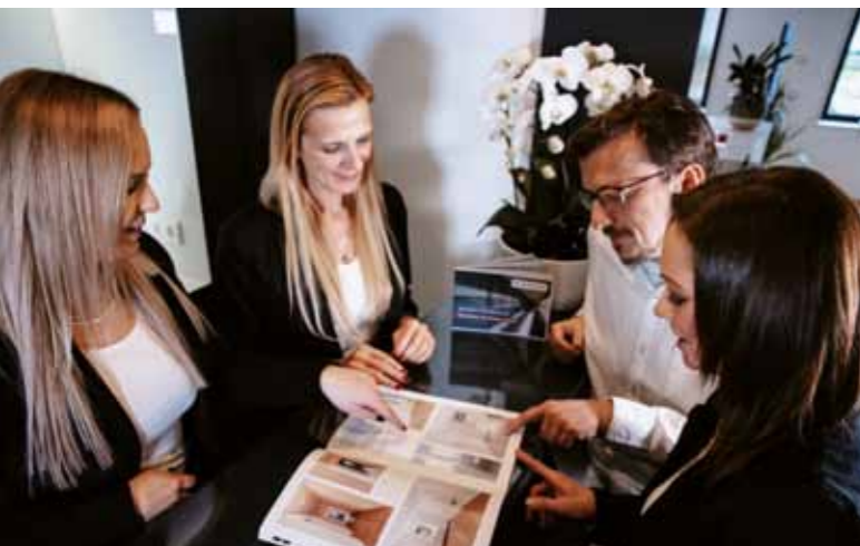
Individuelle Immobilienmagazine stärken den Verkaufsprozess.

Vertrauen Sie auf Experten, vertrauen Sie auf uns, um Ihren Erbschaftsprozess reibungslos zu gestalten.“