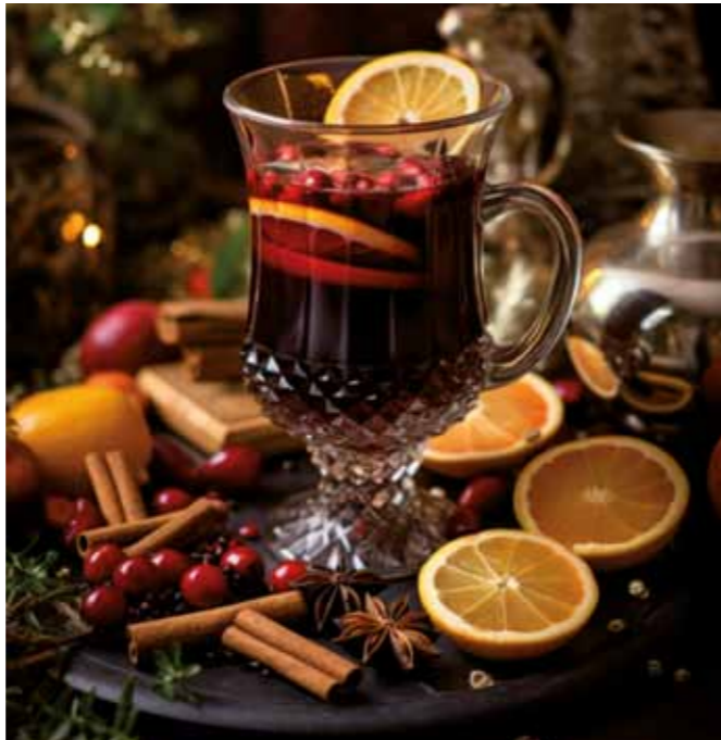
Glühwein steht im Mittelpunkt beim Winterglühen.

Somit hat die Vorstandschaft beschlossen, die Taktik zu ändern und lädt zum „Winterglühen“ im Nordheimer Rathauspark ein. Hier ist es windgeschützt, trocken und bequem zu Fuß erreichbar – perfekt, um Weihnachten und den Winter willkommen zu heißen. Am 21. Dezember 2024 ab 17:00 Uhr verwandelt sich der Park hinter dem Rathaus in ein winterliches Paradies. Die Grillmeister stehen bereit, um den Besuchern köstliche Grillwürste und saftige Steaks im Brötchen zu servieren. Für die kleinen Genießer gibt es knusprige goldene Pommes, die garantiert jedes Kinderherz höher schlagen lassen.