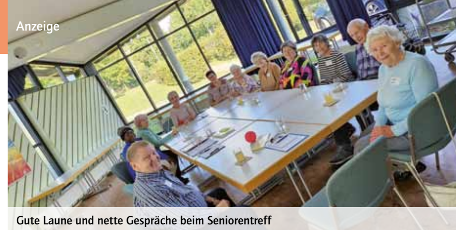
Gute Laune und nette Gespräche beim Seniorentreff