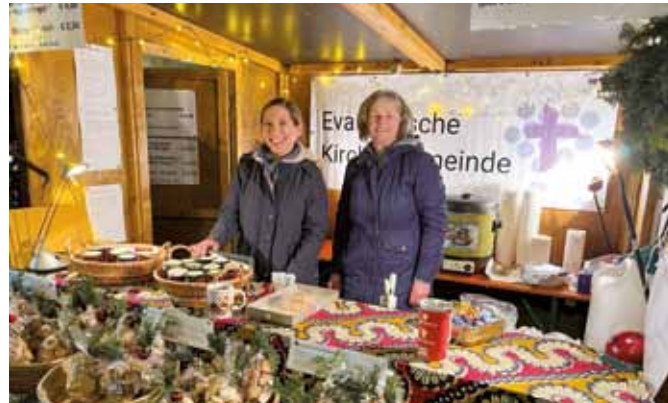
An zahlreichen Ständen wird vieles für die Advents- und Weihnachtszeit angeboten.