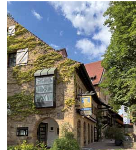
Seit September wieder eröffnet – Restaurant & Hotel HerzogsKelter

„In der Adventszeit am 2., 3. und 4. Adventssonntag laden wir zum festlichen Adventsfrühstück für 26 € pro Person ein“, sagt Mario Lang. „Eine schöne Gelegenheit für Ruhe und Genuss in der Vorweihnachtszeit.“