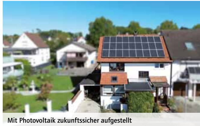
Mit Photovoltaik zukunftssicher aufgestellt

Wer seine Immobilie in den kommenden Jahren verkaufen möchte, sollte daher rechtzeitig über Investitionen in Energieeffizienz nachdenken: Neue Fenster, bessere Dämmung oder eine moderne Heizungssteuerung zahlen sich doppelt aus – durch niedrigere Betriebskosten und höhere Nachfrage.