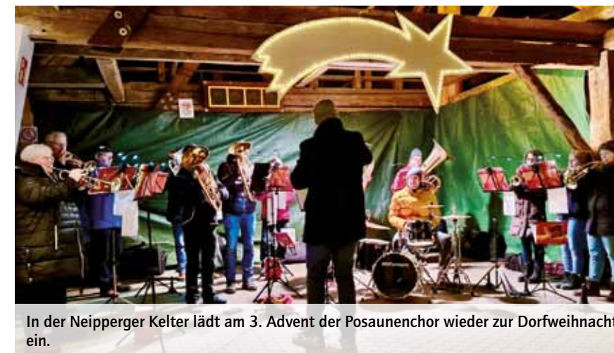
In der Neipperger Kelter lädt am 3. Advent der Posaunenchor wieder zur Dorfweihnacht ein.

versetzen. Frisch gebackene Waffeln runden den Abend ab. Selbstverständlich wird auch der Nikolaus vorbeischauen.