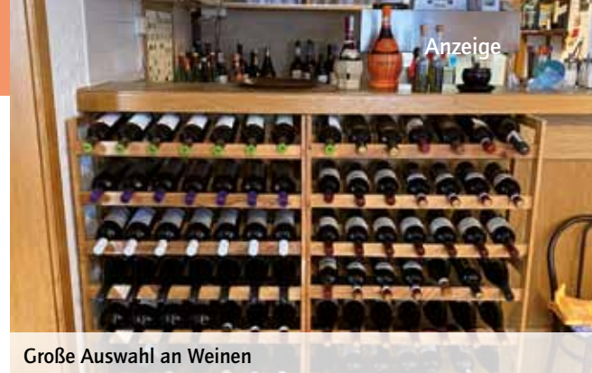
Große Auswahl an Weinen