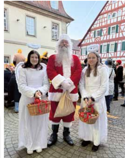
Auch der Weihnachtsmann mit seinen Engeln wird einen Besuch abstatten.