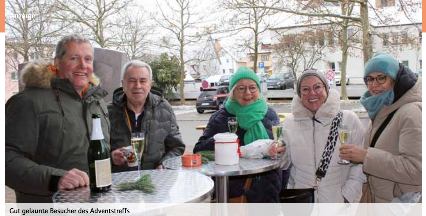
Gut gelaunte Besucher des Adventstreffs