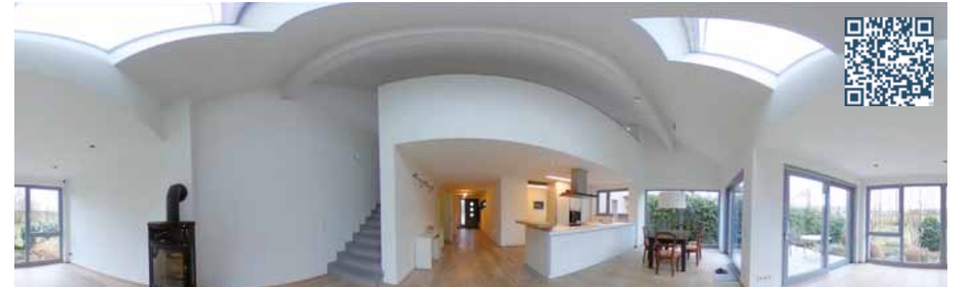
Erleben Sie unseren virtuellen 360-Grad-Rundgang. Scannen Sie den QR-Code und starten Sie die Tour!

Kaum ein Thema bewegt Eigentümer derzeit so stark wie Photovoltaik. Immer mehr Hausbesitzer im Zabergäu nutzen die Chance, ihren eigenen Strom zu erzeugen und so unabhängiger von Energieversorgern zu werden. Moderne Systeme mit Batteriespeicher ermöglichen heute, bis zu 70 % des eigenen Strombedarfs selbst zu decken – ein Plus für Umwelt und Geldbeutel.