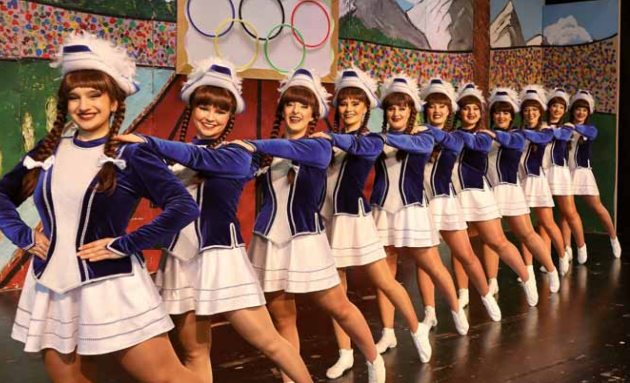
Auch die Tanzgarden der ZNG werden wieder zu sehen sein.