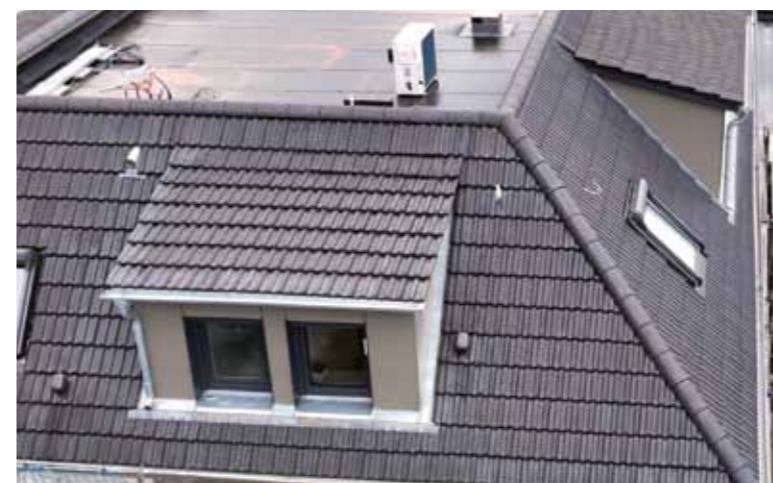
Die Dachrandverkleidung passend zur Gaubenverkleidung