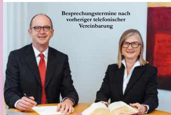
Besprechungstermine nach vorheriger telefonischer Vereinbarung