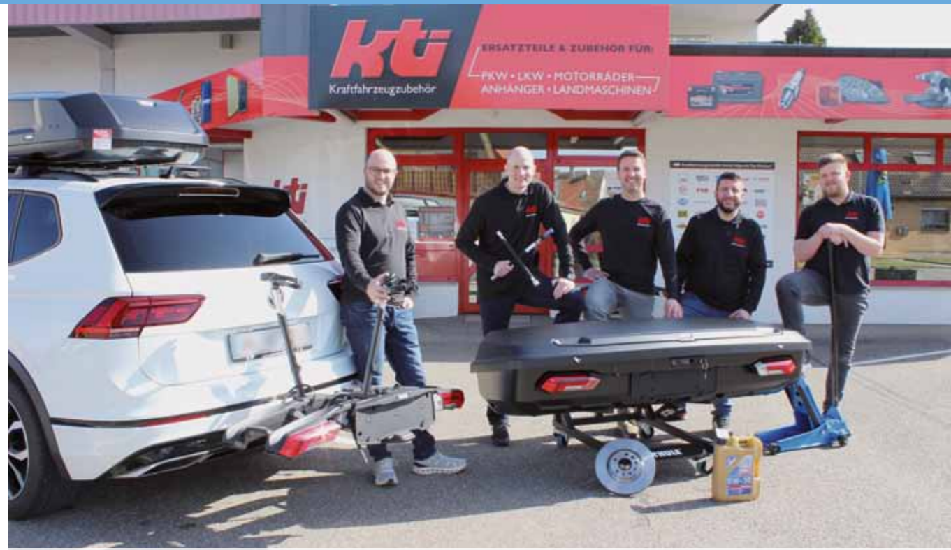
Das KTI-Team präsentiert Autoteile und Zubehör wie Dachboxen, Heckboxen und Fahrradträger.