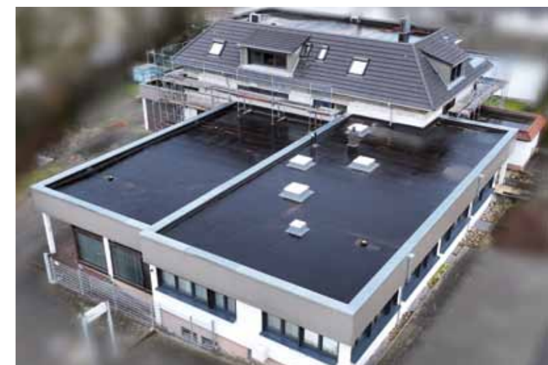
Vorher-Nachher im Vergleich

dung der Flachdächer, welche ein harmonisches Bild mit den Gaubenverkleidungen ergibt. Spürbar wird die Modernisierung aber auch im Geldbeutel, denn die Heizkosten werden merklich reduziert, „wenn man die Heizung abends runterdreht, kühlt es bei Weitem nicht mehr so schnell ab wie vorher“, erzählt die Bauherrin stolz.