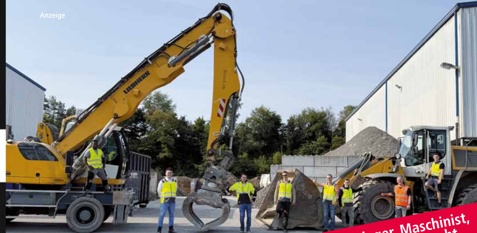
Das Team von RetroLith vor seinen Arbeitsmaschinen

Verwieger, Maschinist, Betonbauer gesucht