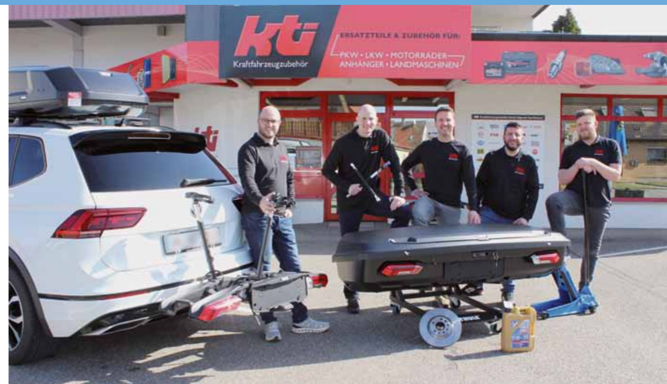
Das KTI-Team präsentiert Autoteile und Zubehör wie Dachboxen, Heckboxen und Fahrradträger.