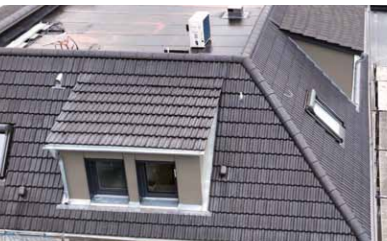
Die Dachrandverkleidung passend zur Gaubenverkleidung

dung der Flachdächer, welche ein harmonisches Bild mit den Gaubenverkleidungen ergibt.