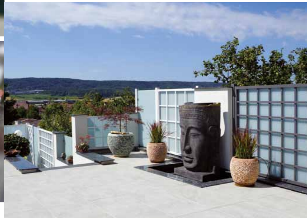
Urlaubsflair dank Terrassenplatten aus Keramik in Kombination mit edlem Naturstein

oder Kalkstein sowie auf Betonlauf und stabilen Stahlkonstruktionen individuell nach Kundenwunsch und auf Maß an und verleihen damit Ihren Gebäuden eine ganz besondere Ästhetik“, erklärt Patricia Perlinger.