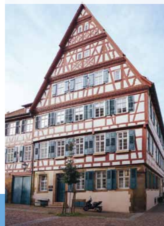
Die Kanzlei in der Kirchstraße 11 in Brackenheim