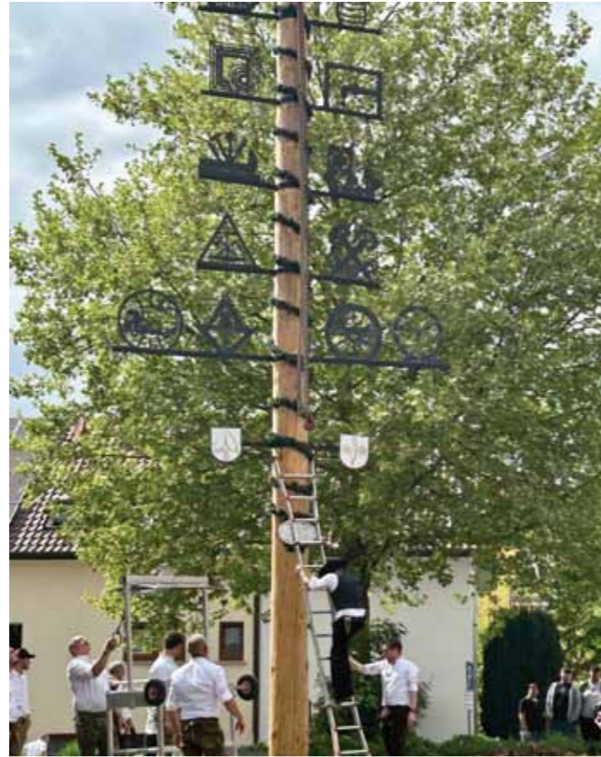
Wenn er dann steht ...