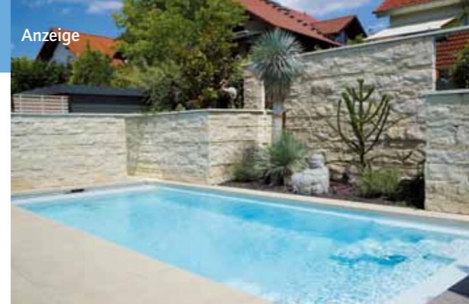
Natursteine verwandeln den Garten in eine Oase der Ruhe und Erholung.

Essinger & Lang Mühlstraße 45 • 74397 Pfaffenhofen Tel.: 07046 467 • E-Mail: frank.essinger@web.de Öffnungszeiten: Montag bis Freitag: 08:00 Uhr bis 12:00 Uhr und 14:00 Uhr bis 18:00 Uhr Samstag: 08:00 Uhr bis 12:00 Uhr