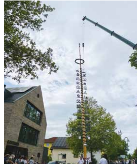
... kann das Fest um 15 Uhr beginnen.

Der Frühling ist da. Während im Garten- und Landschaftsbau draußen gewerkelt und umgearbeitet wird, lädt die Schmuckmanufaktur zum „Frühjahrsputz“ ein. Frühjahrsputz bedeutet hier alte, liebgeordnete Schmuckstücke zu Tage zu fördern, die schon lange auf eine Reparatur oder Änderung warten. Anja