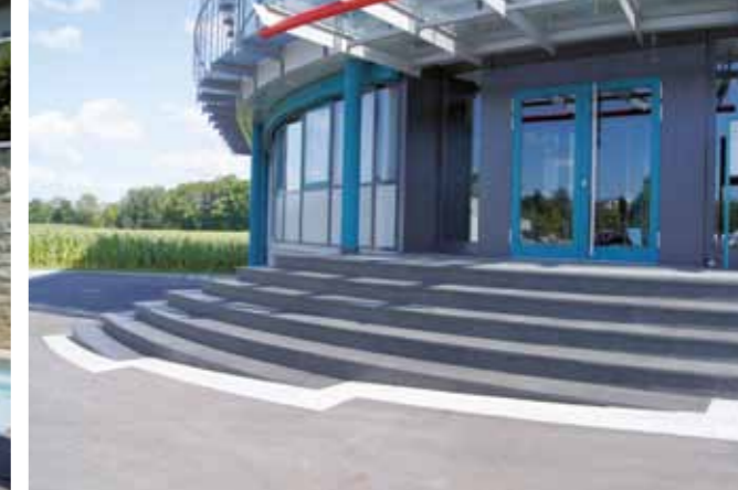
Treppen aus Naturstein verleihen eine exklusive Note.