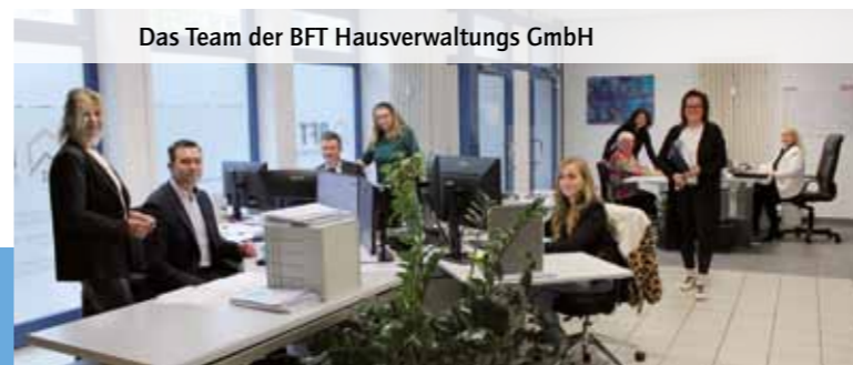
Das Team der BFT Hausverwaltungs GmbH

In den Regionen Heilbronn, Hohenlohe, Ludwigsburg, Sinsheim und Stuttgart betreut das Unternehmen derzeit über 180 Liegenschaften mit mehr als 2000 Einheiten in den Bereichen WEG-, Miet- und Gewerbeverwaltung. Jede Liegenschaft wird von einem festen Team aus Verwalter und Assistent betreut. Dadurch ist auch bei Abwesenheiten eine kontinuierliche und verlässliche Betreuung sichergestellt.