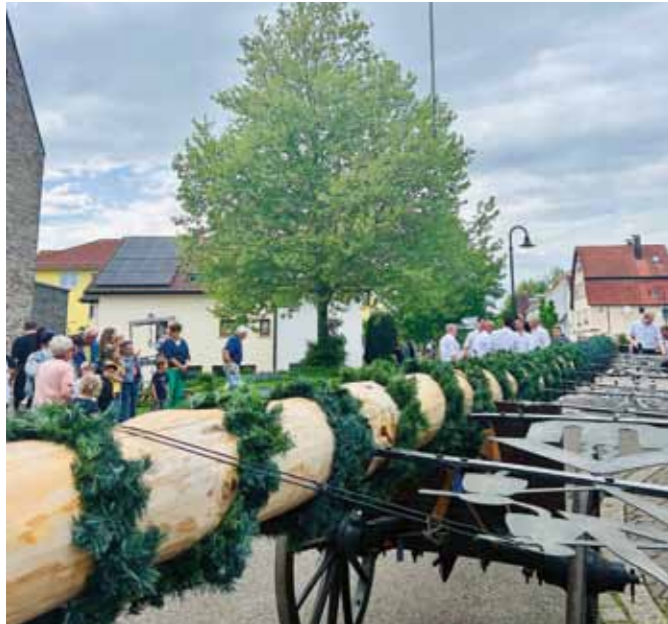
Der Maibaum wird am 9. Mai durch den Ort transportiert und dann gestellt.