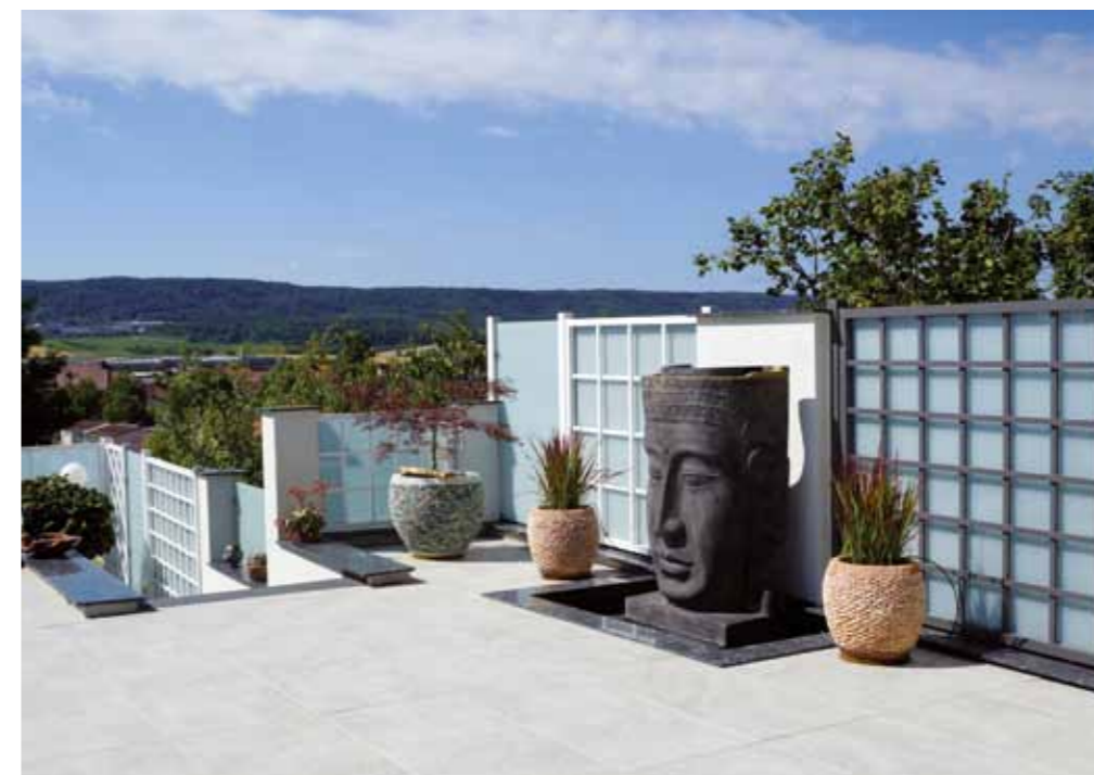
Urlaubsflair dank Terrassenplatten aus Keramik in Kombination mit edlem Naturstein