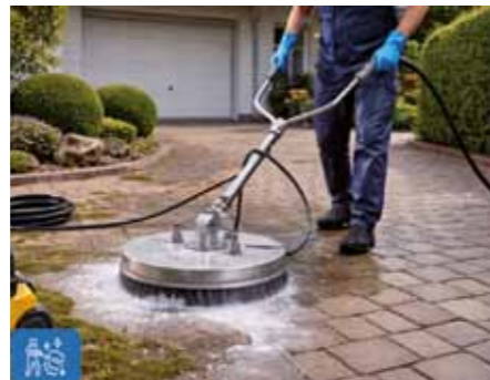
Hof- und Einfahrtsreinigung

keit, Schmutz und Abnutzung zu schützen.