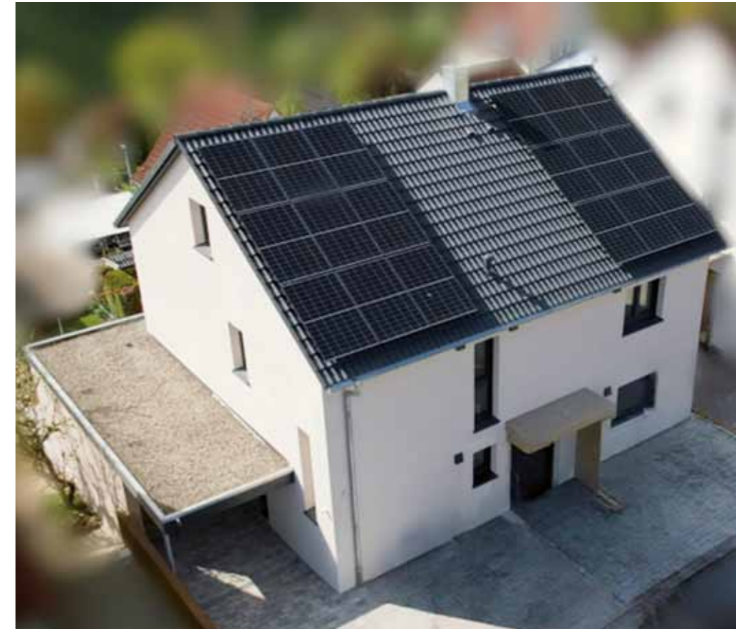
Das sanierte Dach und das verlängerte Garagendach

Bei uns endet die Arbeit nicht am Dach. Ob Fassaden, Balkon- oder Terrassenbeläge – all das gehört zu unserem Leistungsspektrum. Es war uns eine Freude,