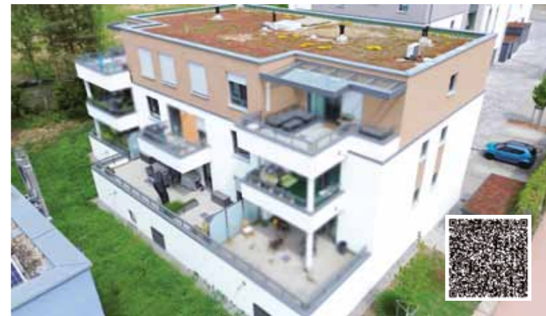
Lichtdurchflutete 3-Zimmer-Wohnung mit Terrasse, Aufzug & Garage