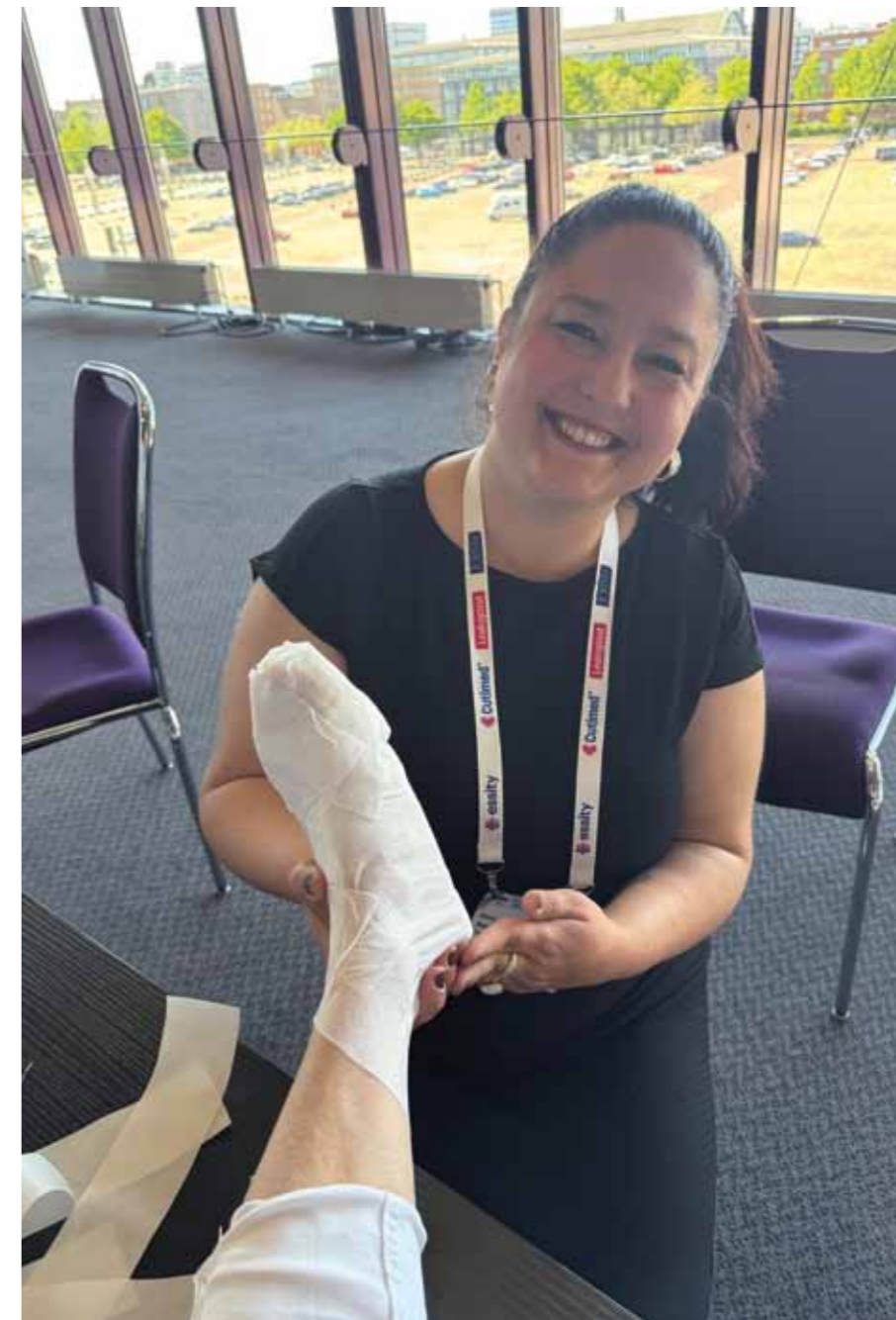
Produkttest auf dem EWMA-Kongress in Bremen (European Wound Management Association)

Pflegedienst Lichtblick Stromberg-Zabergäu Arbeiten mit Herz und Teamgeist