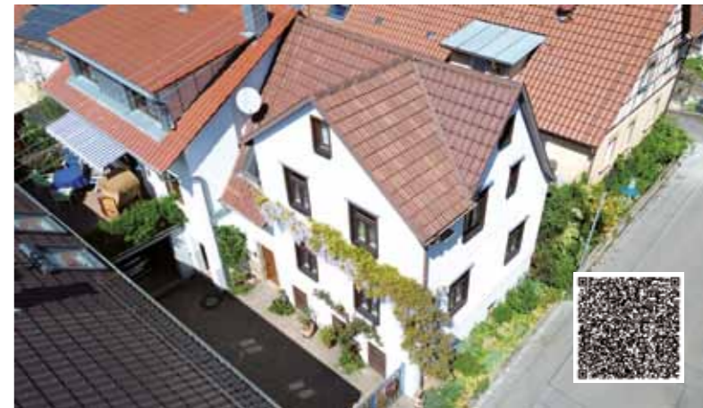
Clebronn – 153 m 2 – charmantes Einfamilienhaus

Umso wichtiger ist es, von Anfang an mit einer klaren Strategie, realistischen Preisen und einer professionellen Vermarktung zu arbeiten.