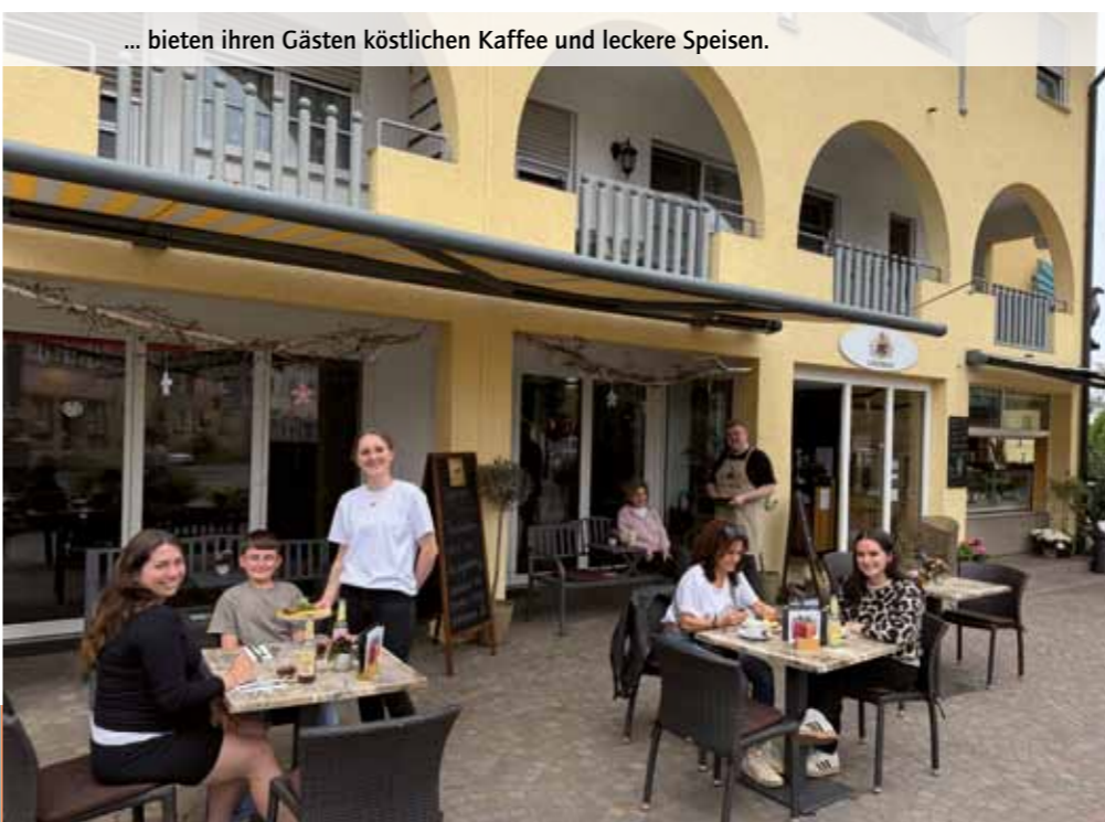
... bieten ihren Gästen köstlichen Kaffee und leckere Speisen.

Mit seiner Mischung aus familiärer Atmosphäre, handgemachten Produkten und kreativer Küche hat sich das Café Primas als echter Wohlfühlort etabliert – ein Treffpunkt für alle, die Qualität, Herzlichkeit und kulinarische Vielfalt schätzen.