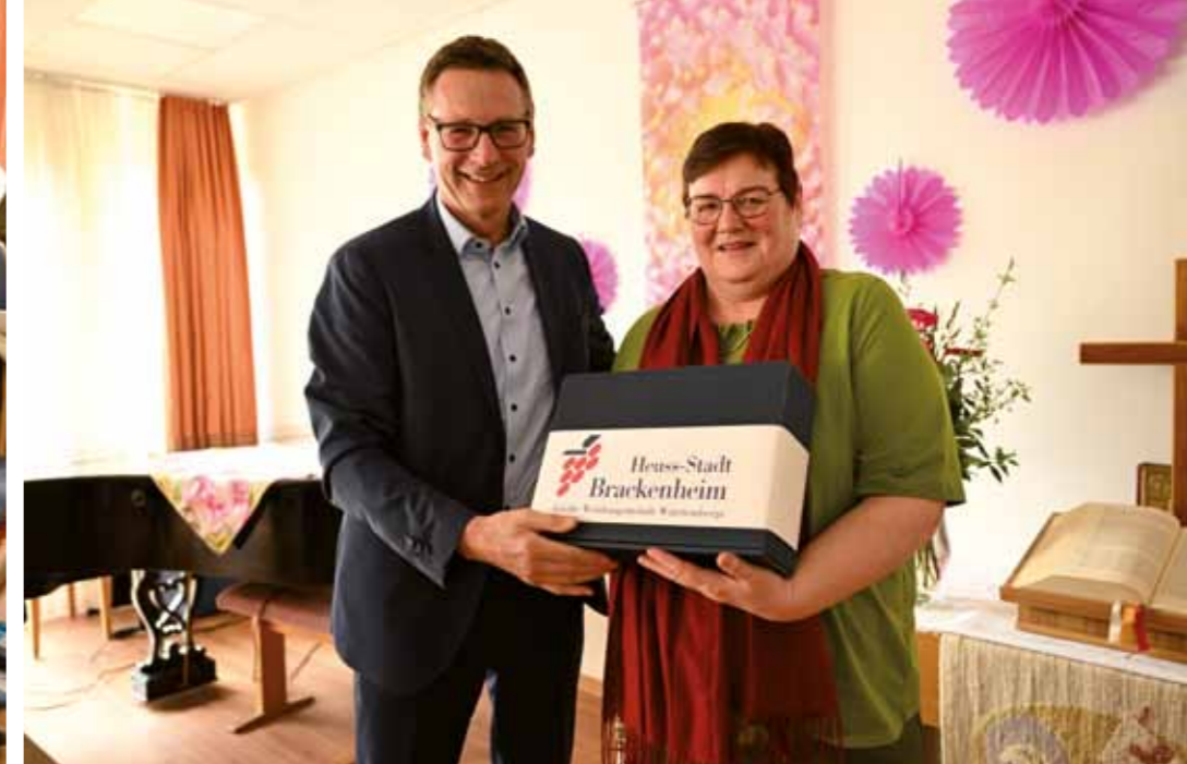
Prominente Gäste beim Führungswechsel im Haus Zabergäu